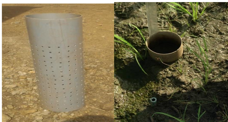
Photo 2 : Vue d'un piézomètre (à gauche) et d'un piézomètre installé dans la parcelle (à droite)

surface du sol ont été testées. Les doses d'irrigation étaient appliquées lorsque le niveau d'eau dans le sol atteint les différentes hauteurs testées à savoir H15 (DI5), H10 (DI7,5) et H5 (DI10).