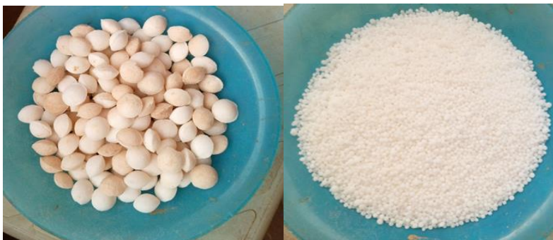
Photo 1 : L'urée super granulée (à gauche) et l'urée perlée (à droite)

Fertilisation : Appliquer le compost, en fumure de fonds, à la dose de 10 t/ha pendant la préparation du sol. Appliquer le NPK (14-23-14), avant ou juste après le repiquage, à la dose de 200 kg ha -1 . Appliquer les deux formes d'urée à la dose de 120 kgha -1 . Epandre l'urée perlée en deux fractions de 1/3 et 2/3 respectivement au tallage et à l'initiation paniculaire. Enfouir manuellement l'USG, uniquement au tallage, à environ 7-10 cm de profondeur. Placer un granule d'USG de 3 g à équidistance de quatre plantes.